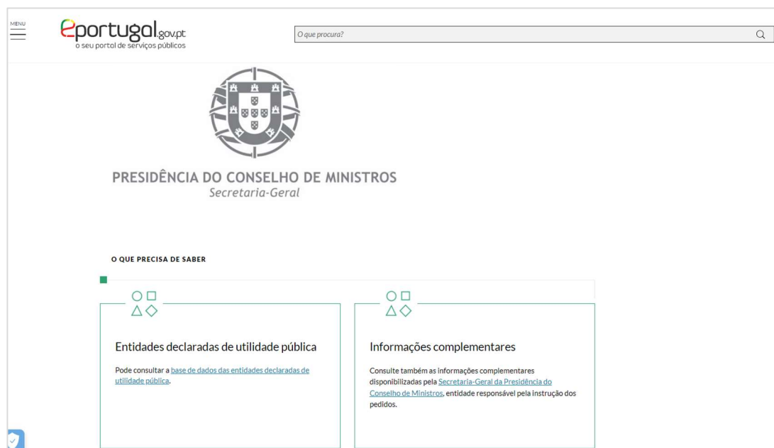
Figura 3 – Vista Geral do Front-End relativo ao PUPF.

O Portal das Utilidades Públicas e Fundações (PUPF) mudou o seu front-end para o site ePortugal, que tem como objetivo facilitar as interações entre cidadãos e empresas e o Estado, tornando-as mais claras e simples. Esta decisão, promovida pela tutela da presidência e modernização administrativa visa cumprir um dos desígnios da Estratégia da Digitalização de Serviços, consagrada pelos Decretos-Lei n.º 73/2014 e 74/2014, de 13 de maio, em que todos os requerimentos apresentados aos serviços públicos podem ser submetidos eletronicamente pelo balcão único, ou seja, o portal ePortugal. Estes diplomas legais determinam ainda que a informação deve ser devidamente organizada pelos serviços e organismos da Administração Pública e que a mesma deve ser atualizada com frequência, de modo a não defraudar as expectativas dos cidadãos e dos agentes económicos.